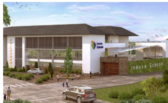
Centro Comercial Costa Mar Plaza en Tumbes e Innova School de Tarapoto. El sector privado provee servicios de calidad en zonas donde predomina la población de ingresos medios y bajos.