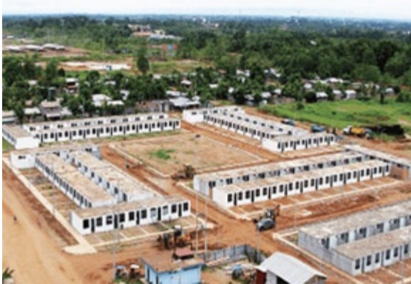
Proyecto Municipal Ucayali en Pucallpa. Modelo de coinversión pública-pública para proveer de servicios de agua y desagüe a proyectos inmobiliarios de vivienda social.

constituirá sobre la base del Instituto Metropolitano de Planificación.