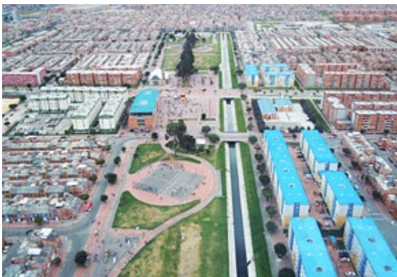
Ciudadela El Recreo, Bogotá: empresa pública de suelo promoviendo la generación de suelo para proyectos habitacionales en alianza con promotores privados. Un modelo a replicar.

El proceso de descentralización puesto en marcha en 2002 encargó la planificación y gestión territorial a las municipalidades, pero existen muchas debilidades