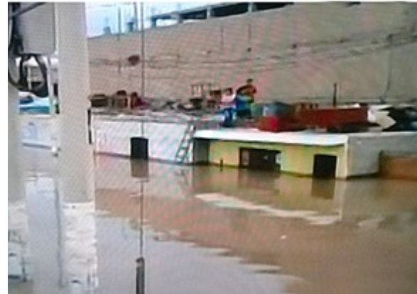
Familia guareciéndose encima de casa Techo Propio – Sitio Propio que resistió inundación durante el Niño Costero en Huaramey. Pero el programa debe fortalecerse

En teoría, la actividad constructora tiene una completa regulación que garantiza el cumplimiento de las