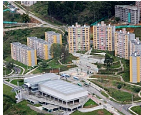
Villa Suramericana, Medellín. Intervención integral en zonas de laderas que incluye vivienda social multifamiliar, mejoramiento de barrios del entorno y transporte público a través de teleféricos.

El empleo de materiales falsificados, que se fabrican informalmente y que incumplen normas técnicas se encuentra extendido en las familias de bajos ingresos e inclusive en los programas estatales de vivienda y