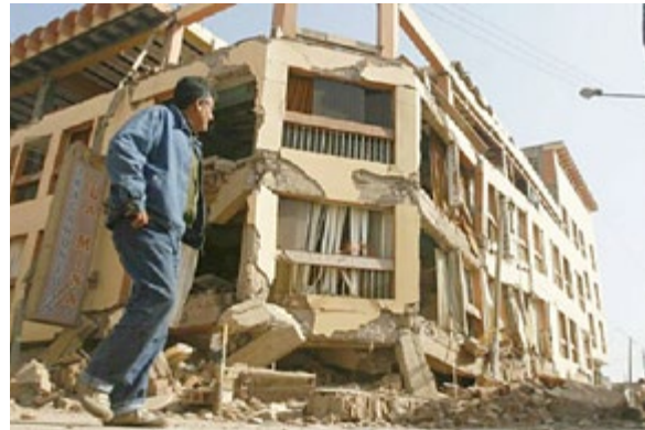
Un sismo en Lima similar al de Pisco, provocaría 51 mil muertos y la destrucción de 549 mil viviendas por la informalidad de las construcciones.

De otro lado, un reporte técnico publicado en el Informe Económico de la Construcción de CAPECO en julio 2018 estimó que aproximadamente el 25% de la inversión inmobiliaria en vivienda y que el 38% de las compras de materiales de construcción corresponde al segmento informal. Un estudio del mercado informal de vivienda desarrollado por Arellano Marketing para CAPECO en 2013 estimó que solo en Lima Metro-