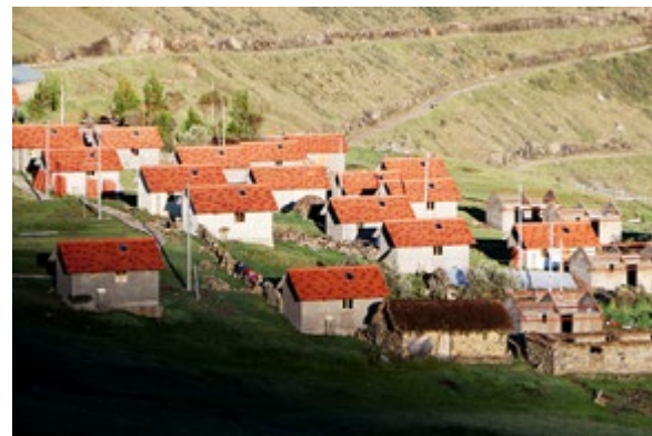
Proyecto Techo Propio en Comunidad Campesina de Yanamayo, Cusco. Rompiendo prejuicios, el sector privado regional provee viviendas sociales en áreas rurales.